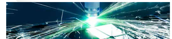
Elektro- & Messtechnik