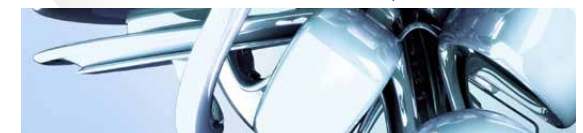
Industrie- & Produktdesign