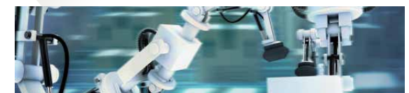
Prozess- & Automatisierungstechnik