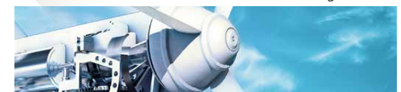
Maschinen- & Anlagenbau