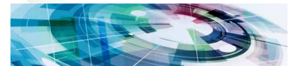
Information & Kommunikation