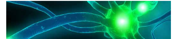
Chemie & Biotechnologie